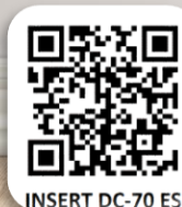
INSERT DC-70 ES